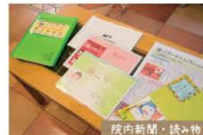
院内新聞・読み物