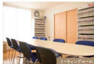
ミーティングルーム