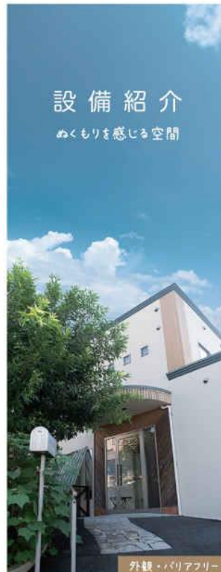
外観・バリアフリー